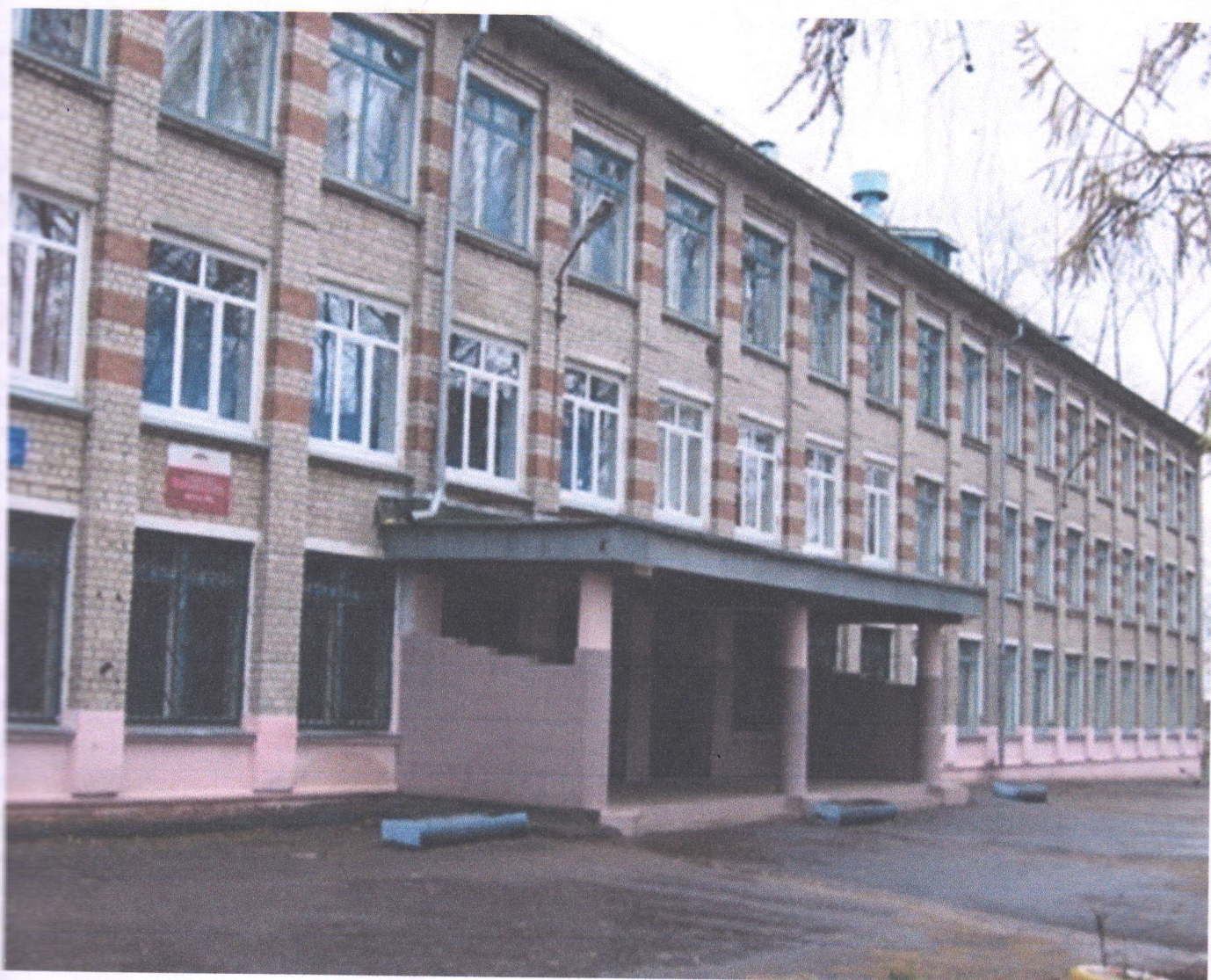
Фасад здания МАОУ СШ № 6